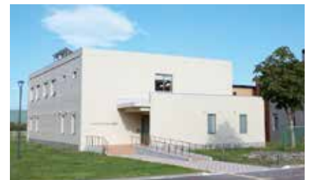
総合教育研究棟（水産系）

総合教育研究棟（水産系）の完成により釜石キャンパスでの教育研究が一層進むものと期待されます。