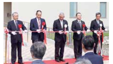
記念式典のテープカットの様子