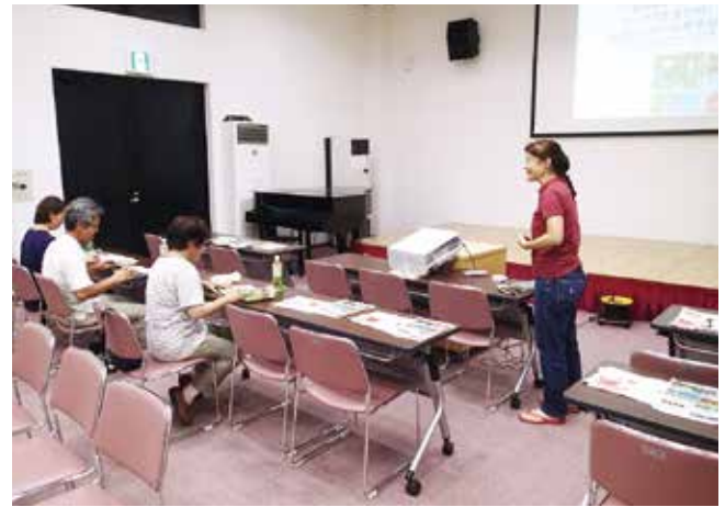
農業振興車座研究会

参加して頂いた農業者へのフォローはもちろん、他の市町村でも意欲ある農業者との交流機会を設けられるよう活動を進めていきます。