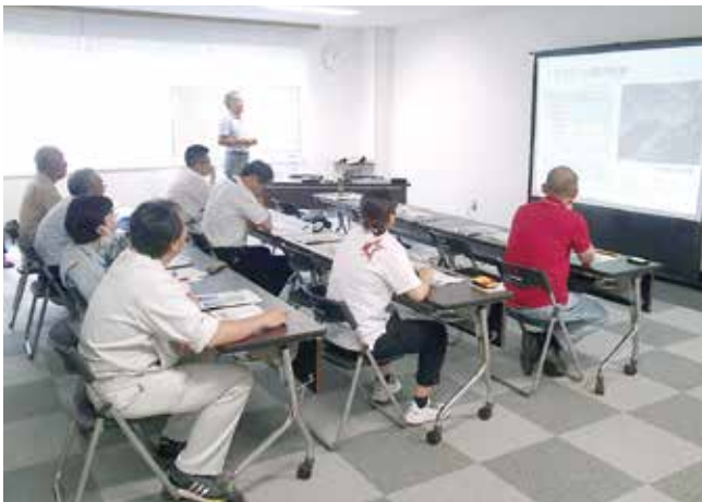
沿岸北部地域の気象の特徴と園芸振興

三陸復興部門園芸振興班は、令和元年7月18日（木）に久慈市役所で「岩手大学 沿岸北部地域の気象の特徴と園芸振興」と題した研究報告会を開催し、続いて8月9日（金）に野田村生涯学習センターで「岩手大学 農業振興車座研究会」を開催しました。