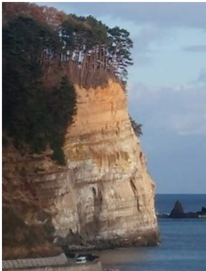
《1억년 역사를 자랑하는 지오파크 단층》