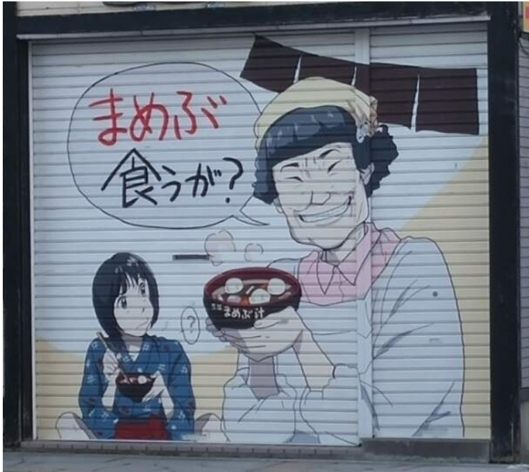
《드라마와 너무 똑같아서 찍을 수 밖에 없었던 '마메부 먹을래?'》