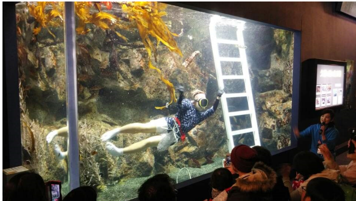
《모구람피아에서 볼 수 있는 관광해녀》

르쉐에서 시금치를 팔고 있었다고 하네요. 그리고 ‘여기 쓰나미 있었던 곳이지’라고 깨닫게 한 표지판도 있었습니다.