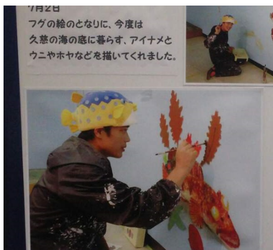
모구람피아를 응원하고있는 예능인이자 교수「사카나군」»