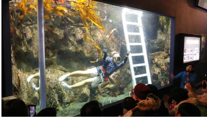
모구람피아에서 볼 수 있는 관광해녀»

는 발랄하게 대답하는게 재미있었네요. 나중에 알게 된 사실인데, 이때 본 관광해녀는 위의 사무라이 마르쉐에서 시금치를 팔고 있었다고 하네요. 그리고 '여기 쓰나미 있었던 곳이지'라고 깨닫게 한 표지판도 있었습니다.