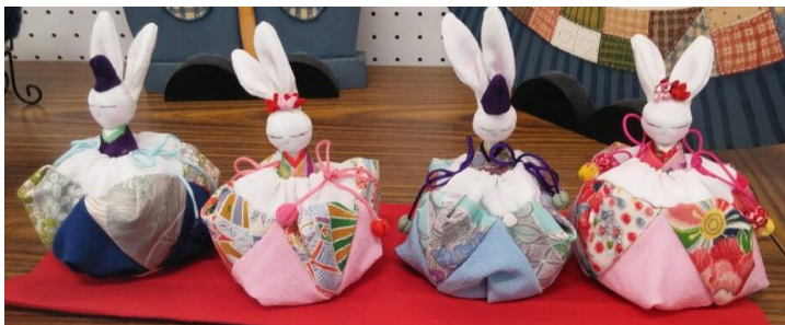
마을 주민이 만든 공예품»

현대판 마츠리라고 생각하는 이 이벤트에서는 가리비, 전복, 꼬치, 생선, 덴가쿠(된장을 바른 두부 구이)등을 팔고있는 가판대와, 체육관 안에서는 여러 전시품을 전시하고있고, 야채나 과일을 저렴한 가격에 팔고 있었습니다. 그리고 점심시간 이후에는 전통춤과 합창 등 주민이 즐길 수 있는 이벤트가 많았습니다.